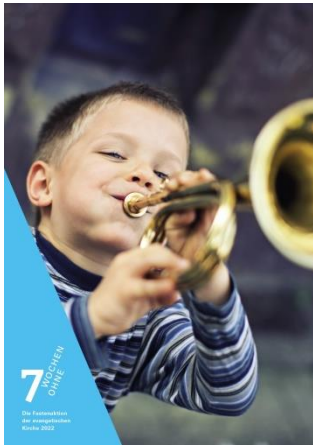
„7 Wochen Ohne/Getty Images“

Den Beginn der Passionszeit eröffnet die Kirchengemeinde Wasungen mit einem Gottesdienst zum Aschermittwoch , 2. März, um 17.00 Uhr in der Stadtkirche.